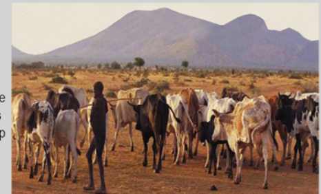
Ayangawu ejulakine lo ekuse lo ikwamin ationis ne etamitor akwap adolokin nu aitojokar aijar itunga.

Nu kere ayangautu atwaniar na epol aticepak na erono kakere. Naanyunet, atwakata itunga, atwakata ibaren, atiyaikinos idaracan, amudiaros iraan, abwangununos adekasinei nu ikopasi kakipi kwape e' cholera keda adekasinei ace nu ewupasi keda ebulore, aijesun na adoletait na akipi keda awokinikin na icorin.