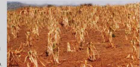
Ageu aijar ka itunga aijulakin kanu ejulakine lo epone lo etepia edou na yangau ainingosio nu itetiak kanu apolo.