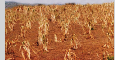
Epiyo ngitunga akiboikin nakiyar ngina ajokan anera angopiya akiru ka ecamit angopiyar jik