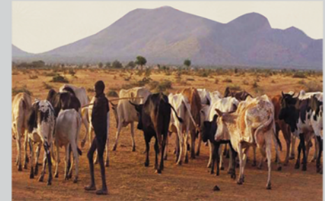
Esipiyo Aonite alo Uganda apukan kaapei ka ngitunga ayeun akiyar ngina ajokan

Ayaut ngakiro nugu daadang ngican ngulu apolok ka ngulu aronok, anera atwaka ngitunga ngulu alalak, atwaka ngibaren, aritanakin ngidaracai, aleleya ngikinyom anamanat, abwangun ngidekesio angakipi ikwa cholera, ejuanasi ngataparin dang.